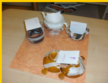
Puzzelen en plakken op de buitenschoolse opvang