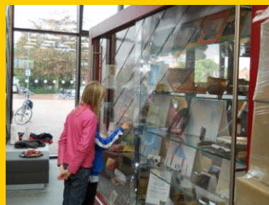
De vitrine in het nieuwe gemeentehuis van Heemskerk