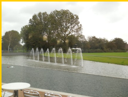
De nieuwe vijver achter het gemeentehuis

Verder is de vijver achter het nieuwe gemeentehuis nagezocht en de beek naar de sloot bij de kruising van de Zaalberglaan.