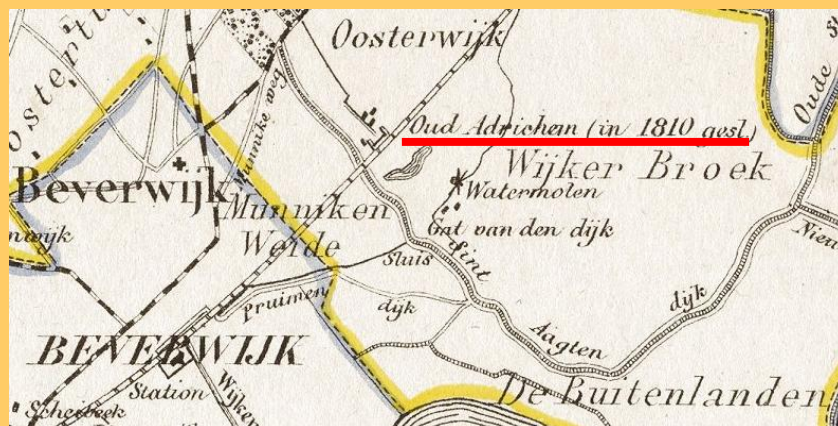
Op de kaart van Kuyper uit 1867 is het kasteel Adrichem alleen nog maar aangegeven als zijnde gesloopt en wel in 1810.