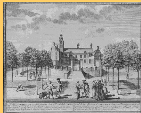
Hendrik de Leth 1728