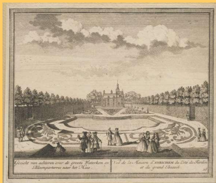
Hendrik de Leth 1728 achterzijde