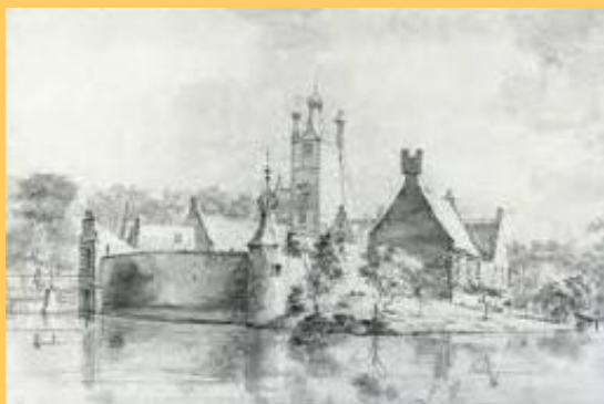
Roelant Roghman 1646-1647

We weten nu de locatie van het kasteel maar we weten ook hoe het er in vroeger tijden heeft uitgezien. Er zijn verschillende afbeeldingen van gemaakt en bewaard gebleven.