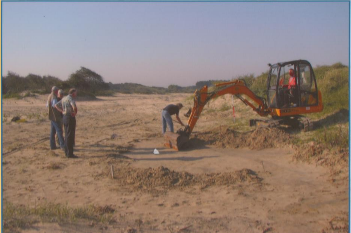
Opgraving op het terrein Groot Olmen