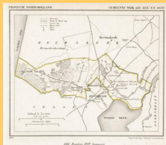
Wijk aan Zee en Duin in 1869

De naam Beverwijk heeft niets met knaagdieren of een bedevaart te maken, maar vindt waarschijnlijk zijn oorsprong in de naam Beverhem. "Bever" zou de naam zijn van een Germaanse man en de toevoeging -hem betekent zoveel als "woning of nederzetting van". De plaatsnaam Beverhem wordt voor het eerst genoemd in de goederenlijst die hoort bij