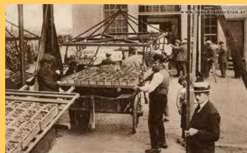
Aardbeivenveiling in Beverwijk

Beverwijk is nu vooral bekend om zijn Beverwijkse Bazaar, de grootste overdekte markt van Europa.