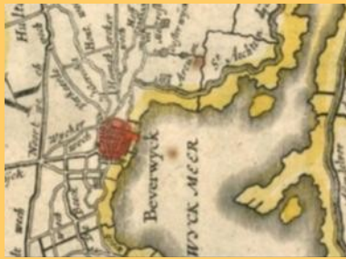
Beverwijk in 1645

Beverwijk ligt in het zuid-westen van de Nederlandse provincie Noord-Holland, ongeveer 20 kilometer ten noord-westen van Amsterdam en 15 kilometer ten noorden van Haarlem. De gemeente grenst westelijk aan de Noordzee. Het strand van Wijk aan Zee is het breedste van (het vasteland van) Nederland. Door het uiterste westen en door Wijk aan Zee loopt de Europese wandelroute E9, ter plaatse ook North Sea Trail of Hollands Kustpad geheten. De E9 loopt langs de kust van Portugal naar de Baltische staten.