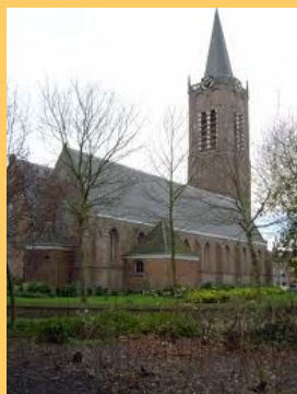
De Grote Kerk met Wijkertoren nu en toen