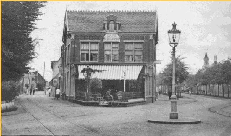
Het begin van de Breestraat, Café Bellevue met links de Koningstraat en rechts de Breestraat

Het voornaamste en aanzienlijkste van de Beverwyk bestaat in eene ruime Straat, de Breedestraat genaamd, die met een dubbele ry schoone Lindeboomen beplant is, en op welke eenige dwersstraten ter eener zyde naar de Agterstraat, en ter andere zyde op de Haven uitloopen. Het Stadhuis, een eenvoudig Gebouw, met een klein Toorentje uit het Dak, staat op de Breedestraat. Aan het einde der Agterstraat in het Noorden van de Beverwyk is de Kerk, een ruim en deftig Gebouw, met een hoogen vierkanten Tooren, door een agtkanten Spits gedekt, die vry verre in Zee kan gezien worden. Men rekent dat er 1300 Inwooners zyn; waar onder veelen, die van hunne overgegaarde Inkomsten een stil leven zoeken.