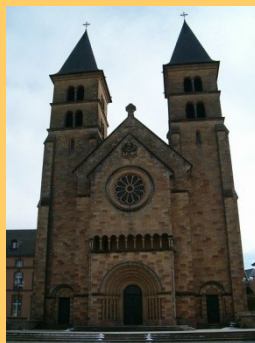
De abdij van Echternach