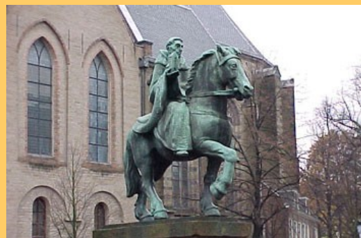
Beeld te Utrecht van Willibrord als missionaris