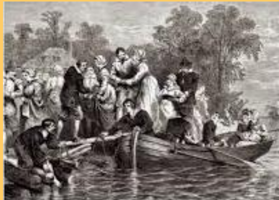
Aankomst van vrouwelijke kolonisten in de Nieuwe wereld

Mannen op zoek naar een huwelijkspartner maakten de meeste kans in het nabijgelegen Nieuw-Amsterdam en weduwen hadden in de kolonie geen enkele moeite om een tweede man te vinden. Andere jongemannen vergrepen zich, tot onvrede van de predikant en de patroon, aan de Indiaanse vrouwen. De oplossing hiervan zag men in het stimuleren van vrouwen om als kolonisten naar Rensselaerswijck te komen. Hier lag een taak voor de patroon in Holland die zich dan ook vlijtig van die taak kweet. Ook gezinnen met veel dochters waren extra welkom. Vanaf 1644 was er dan ook een toename in het aantal familie-immigraties naar de kolonie. Toch is het tekort aan vrouwen is in de periode tot 1664 nooit helemaal opgelost.