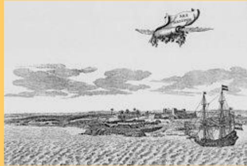
Gezicht op Fort Oranje

Op de westelijke oever van de Hudson werd in 1624 Fort Oranje (Fort Oranije) (in het Engels Fort Orange) in gebruik genomen. Het was het eerste Nederlandse permanente fort in het gebied waar vandaag de dag de staat New York ligt. Fort Oranje verving het in 1615 gebouwde Fort Nassau dat regelmatig te kampen had met hevige overstromingen. Fort Oranje was toen niet meer dan een van hout gemaakte vesting en eigendom van de West-Indische Compagnie (WIC). Het diende als handelspost voor de bonthandel die in die tijd een grote inkomstenbron was voor de WIC.