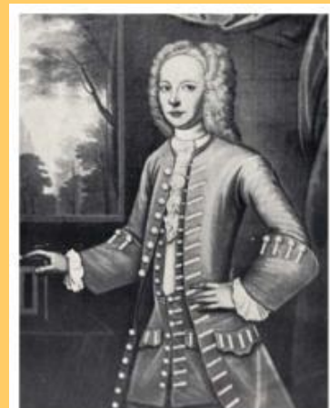
Kiliaen Van Rensselaer