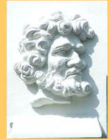
Fantasiereliëf van Floris de Zwarte

Floris kwam tweemaal in opstand tegen zijn oudere broer, Dirk VI. De eerste maal werd hij gesteund door zijn moeder Petronilla, Andries van Cuijk (de bisschop van Utrecht) en de rooms-koning, zijn oom Lotharius III. In 1129 werd het conflict bijgelegd, waarna Floris zich korte tijd, ongeveer 2 jaar lang, graaf van Holland mocht noemen. In augustus 1131 kwam Floris opnieuw in opstand. Ditmaal steunde zijn moeder hem niet en moest hij uitwijken naar het gebied van de West-