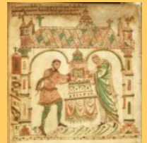
Miniatuur in het Evangeliarium

Dirk II, geboren rond 932, graaf vanaf ongeveer 965 tot zijn overlijden te Egmond op 6 mei 988. Dirk II (of Diederik II) was een Friese graaf die het feitelijke bewind voerde over drie graafschappen die tezamen het gehele kustgebied tussen de Oosterschelde en het Vlie opvulden, zijnde de gouwen: Masaland(Maasland), Kinhem (Kennemerland) en Texla(Texel). Op 15 juni 950 schonken Dirk II en zijn vrouw Hildegard aan Egmond ter ere van de bijzetting van Sint Adelbert een stenen kloosterkerk. Ook schonken zij het Evangeliarium van Egmond, thans een van Nederlands belangrijkste cultuurhistorische voorwerpen uit de vroege middeleeuwen. Het negende-eeuwse handschrift werd circa 975 door hem verworven en bevat de tekst van de vier evangeliën. Dirk en Hildegard zijn afgebeeld op twee miniaturen, die Dirk voor de gelegenheid aan het boek liet toevoegen. Op 25 augustus 985 kreeg Dirk zijn drie lenen van koning Otto III in vrije eigendom. Dirk en zijn vrouw zijn in de abdij van Egmond begraven.