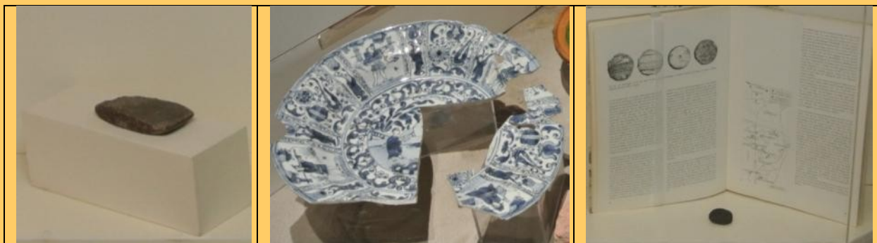
Een laat-neolithische vuistbijl uit Haarlem, een Chinese porseleinen schotel uit Beverwijk en een speelschijfje uit Velsen.