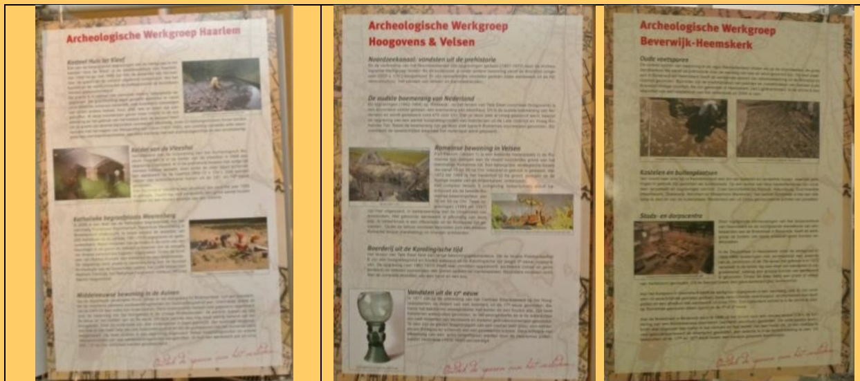
De drie informatieborden met daarop nadere informatie over de vindplaatsen van de getoonde vondsten per werkgroep