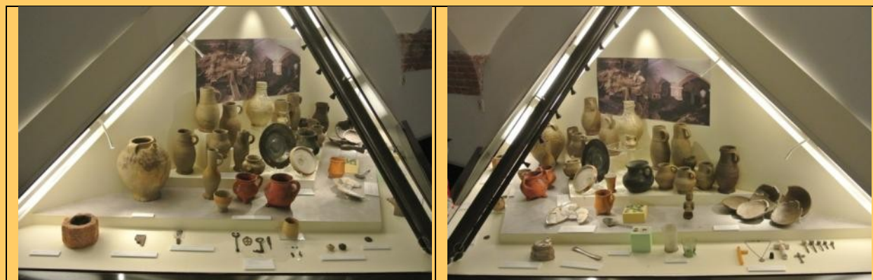
De volgende vitrine met vondsten vanaf de 8 e eeuw tot de 20 e eeuw NJ