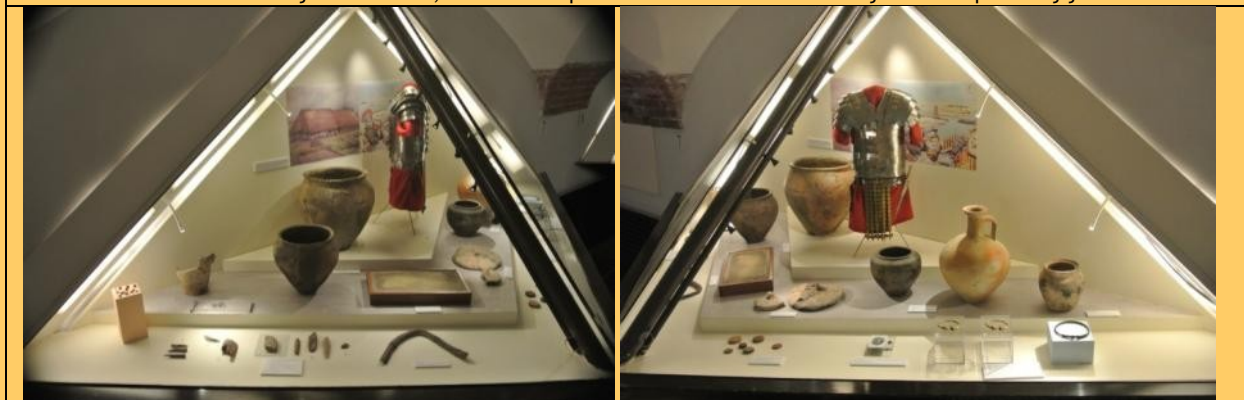
Linker en rechterkant van de volgende vitrine met vondsten van rond de jaartelling