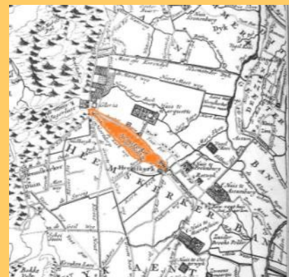
In het rood de geestgrond van Heemskerk

De eerste bewoning vond plaats op de geest van Heemskerk, een zandbank die door de terugtrekking van de Noordzee en de vorming van de jonge duinen droog kwam te liggen. De geestgrond is nog steeds duidelijk zichtbaar, zowel in het stratenpatroon als op de gemeentekaart. Aan de zuidkant loopt Kerkweg en aan de Noordkant de Oosterweg. De oostelijke punt van de geest is tevens het middelpunt van het dorp en de locatie waar de dorpskerk staat. De westelijke punt eindigt bij de Rijksstraatweg bij het buurtschap Noorddorp. Op de geest zijn sporen en aardewerk aangetroffen uit zowel de Merovingische als de Karolingische periode (vroeg Middeleeuwen).