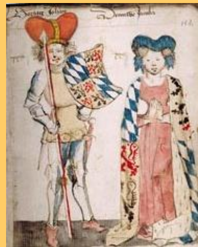
Jan van Brabant en Jacoba van Beieren