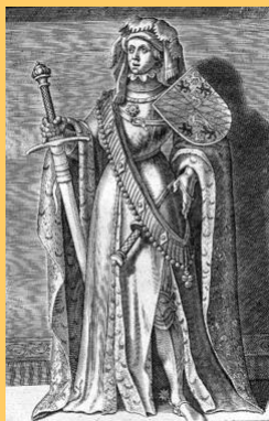
Albert van Beieren

Die plek was het wel waard met zulk een herinneringsteeken vereerd te worden. Zeide de overlevering, dat de graven van Holland en Zeeland, er als heeren van Kennemerland gehuldigd waren, thans reeds is gebleken, dat deze overlevering geen verdichting, maar waarheid is geweest. De overlevering werd het eerst vermeld door JUNIUS in zijne Batavia (1575); en deze is door alle latere plaatsbeschrijvers en plaatspoëten nageschreven. De meesten daarvan zijn aangevoerd in SMIDS, Schatkamer enz. en BROUERIUS à NIDEK, Kabinet van Nederl. Oudheden en het Verheerlijkt Kennemerland. Met voorbijgaan van hetgeen bij deze te lezen is, willen wij ons enkel bepalen tot hetgeen bij hen niet is te vinden, te weten, het antwoord op de vraag: of het historisch zeker is, dat op dien heuvel meer dan één der Hollandsche graven als heer van Kennemerland gehuldigd is? Wij kunnen op die vraag bevestigend antwoorden, en zullen de bescheiden beknopt mededeelen.