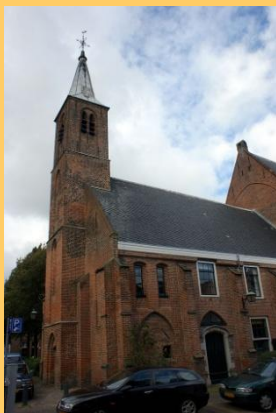
De Waalse kerk voorheen de begijnenhofkapel in Haarlem