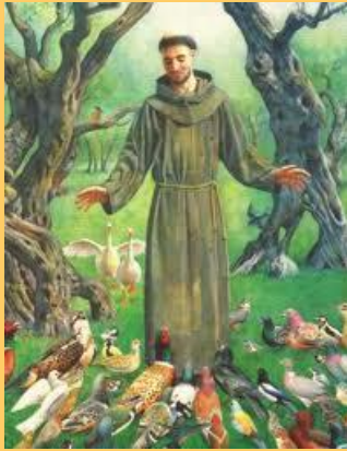
Sint Franciscus van Assisi

De zusters van het klooster Hermon waren religieuzen van de derde orde van Sint Franciscus. De Derde Orde is een groep mensen die leven volgens de Derde Regel van rooms-katholieke of anglicaanse religieuze orden. De leden worden wel tertiariissen genoemd. De Derde Orde wordt verdeeld in een reguliere en een seculiere tak. De eerste