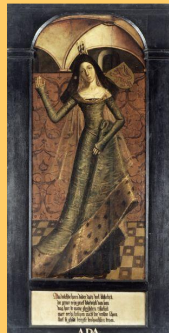
Ada van Holland

is verbonden. Blijkbaar was over de rechts-