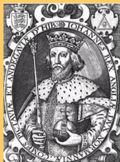
Koning John van Engeland