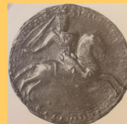
Willem van Friesland