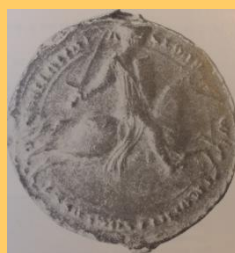
Lodewijk van Loon