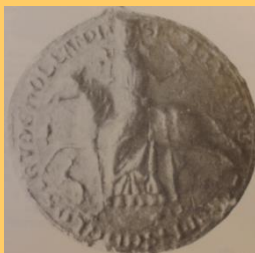
Ada van Holland

We zeiden al dat er 4 hoofdrolspelers waren. De twee anderen zijn Ada's moeder, Aleida van Cleef en Ada's echtgenoot, Lodewijk II van Loon. Om de positie van Ada te verstevigen liet haar moeder de 15-jarige Ada nog voor de begrafenis van haar vader trouwen met Lodewijk II van Loon.