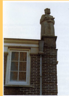
Beeld op het oude raadhuis