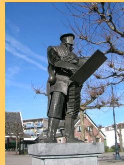
Voorzijde beeld van Maerten van Heemskerck op het Kerkplein

Op het graf van zijn vader, op het kerkhof van Heemskerk, liet hij een azuurstenen pyramide of grafspits bouwen. Bovenop staat het gehouwen beeld van zijn vader en het grafschrift in Latijn en in het Nederlands. Dan staat er nog een kindje op doodsbeenderen waar vuur doorheen speelt. Het zinnebeeld van onsterfelijkheid. Er onder staat: Cogita mori. Beneden ziet men zijn wapen met boven aan de rechterkant een dubbele arend en links een leeuw, onder een naakte gevleugelde arm met een pen of penseel in de hand rustend op een schildpad. Voor het onderhoud van deze pyramide werd door Maerten ook een stuk land bestemd met dien verstande dat, als men het monument liet vervallen, de familie het land in bezit mocht nemen.