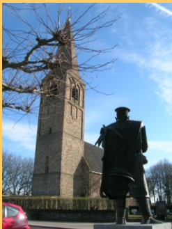
Achterzijde beeld van Maerten van Heemskerck op het Kerkplein

Terug in Nederland kreeg hij al snel belangrijke opdrachten. Hij werd één van de succesvolste kunstenaars van Nederland. Hij vestigde zich in Haarlem waar hij de rest van leven bleef wonen. In 1570 werd hij door het gemeentebestuur van Haarlem vrijgesteld van het betalen van de stedelijke belasting 'op grond van zijn grafische vaardigheid waarin hij uitblonk'. Hij verkeerde in de betere kringen, werd kerkmeester, had verscheidene bestuursfuncties in het gilde en was actief in de rederijkerskamer. Veel van zijn opdrachten kwamen voort uit zijn contacten met aanzienlijke Haarlemse families.