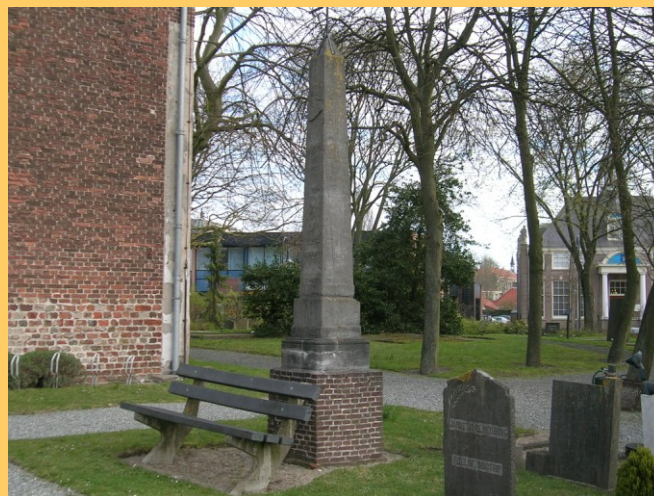
De replica van het gedenkteken voor de vader van Maerten van Heemskerck op het kerkhof van de dorpskerk te Heemskerk.

Het originele gedenkteken staat tegenwoordig ter bescherming tegen weersinvloeden in de toren van de dorpskerk. Op het kerkhof staat een replica.