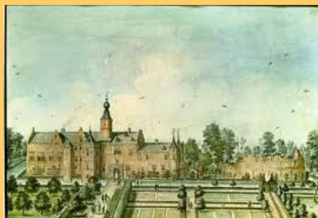
De tuin en parkaanleg rond 1720

Het landgoed zelf is vrij toegankelijk en wordt gezien als een oase van rust in het moderne drukke Heemskerk.