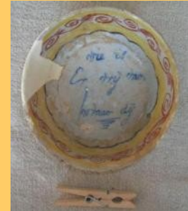
Wie is er vrij van hovaardij

Als laatste nog even een spoor van de kleding uit vroeger tijden. Stoffen vergaan vrij snel, dus worden die ook weinig gevonden. Kledingresten zijn dan vaak ook niet voldoende om te kunnen reconstrueren hoe het er nu precies uitzag. Hiervoor zijn we dus over het algemeen aangewezen op afbeeldingen en beschrijvingen uit vroeger tijden. Een uitzondering vormt het schoeisel waarbij vooral de zolen de tand des tijds nog weleens weten te weerstaan. Dit kinderschoentje is daarvan een heel mooi voorbeeld. U ziet de zij, onder en binnenzijde van het schoentje. De bovenkant is vergaan maar de spijkertjes en de hak zijn nog zichtbaar.