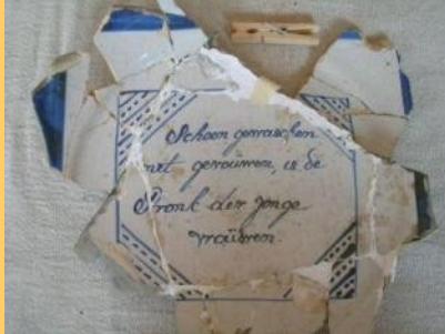
Schoon gewassen net gevouwen, is de Pronk der jonge vrouwen

Dat is wel het geval bij de drie volgende voorbeelden. Die zijn dan ook uit een veel latere periode, de 17 e en 18 e eeuw. Ze geven heel duidelijk de sporen aan van het gedachtegoed van de mensen die toen leefden. Vooral de eerste spreuk op een schotel die waarschijnlijk als huwelijksgeschenk aan de jonge echtgenote werd gegeven is, hoe waar het ook mag zijn, heden ten dage geen geschikt huwelijkscadeau meer.