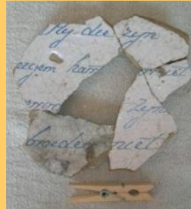
Hij die zijn eigen hart doorziet, veroordeelt zijnen broeder niet