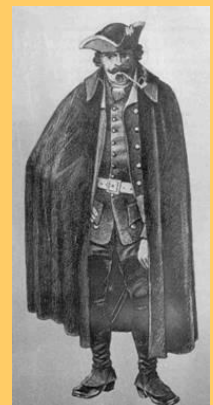
Veldwachter ca 1800

Godsdienstoefeningen zodat deze niet verstoord werden