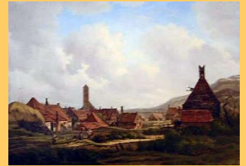
Wijk aan Zee rond 1834

Daarnaast verviel rond 1800 Wijk aan Zee door verschillende oorzaken tot grote armoede. Met als gevolg dat groepen inwoners wel gedwongen waren om bedelend naar Beverwijk, als dichtstbijzijnde stad, te trekken om te kijken of daar nog iets te halen viel. Deze armoede hield aan totdat Wijk aan Zee rond 1840 werd ontdekt als badplaats.