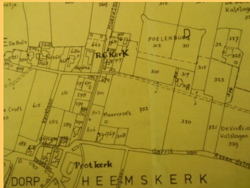
Kaart van 1877