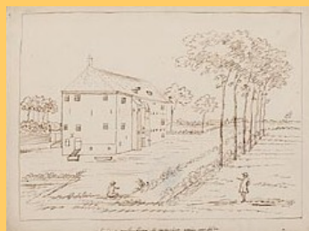
H. Pola circa 1718