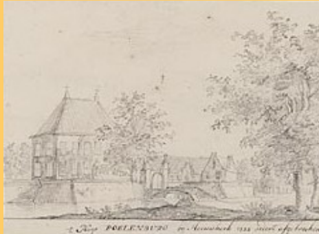
anoniem 1727 na de afbraak getekend

Na verschillende eigenaren werd het huis op 5 december 1724 verkocht aan een achttal Heemskerkers voor fl. 8.600,-. Het huis werd omschreven als 'het huis Poelenburch met deszelfs koetshuijs, stallingen, twee bouhuizen, boomgaarden, lanen, houtgewassen en landerijen rondom hetzelfde gelegen, groot 18 morgen en 16,5 roeden.' gelegen ten oosten van de huidige Gerrit van Assendelftstraat. Aan de noordkant werd het landgoed begrensd door de Maerelaan en ten oosten door de Hecksloot. Erbij behoorden ook 'het Maerehuis' en de 'Vogelkooi' en nog een tiental percelen land.