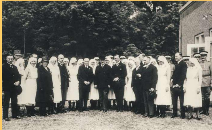
De opening van het zusterhuis in 1930 door ZKH prins Hendrik

Natuurlijk waren alle verpleegsters ongehuwd. Als ze kennis kregen aan een jongeman en het werd serieus dan stond hem eerst een goedkeuring van de directrice te wachten. Netjes voorstellen en een gesprek voordat hij haar in haar vrije tijd mocht opzoeken. Ging een verpleegster trouwen dan volgde automatisch ontslag. Ze moest zich vanaf dat moment bezig houden met haar gezin.