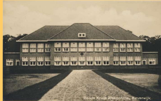
Het Rode Kruis Ziekenhuis aan de Vondellaan rond 1929

In 1948 gingen de tarieven omhoog. Dat betekende per dag voor ziekenfondspatiënten F 4,75 in plaats van F 4,15, voor patiënten der tweede klasse F 7,50 in plaats van F 6,75 en voor de eerste klasse F 11,50 in plaats van F 10,80 met daarbij de aantekening dat men door alle gestegen kosten men maar nauwelijks de werkelijke kosten kon dekken.