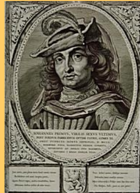
Van graaf Floris V van Holland in 1276 het marktrecht en van zijn zoon, graaf Jan I van Holland, in 1298 het stadsrecht.