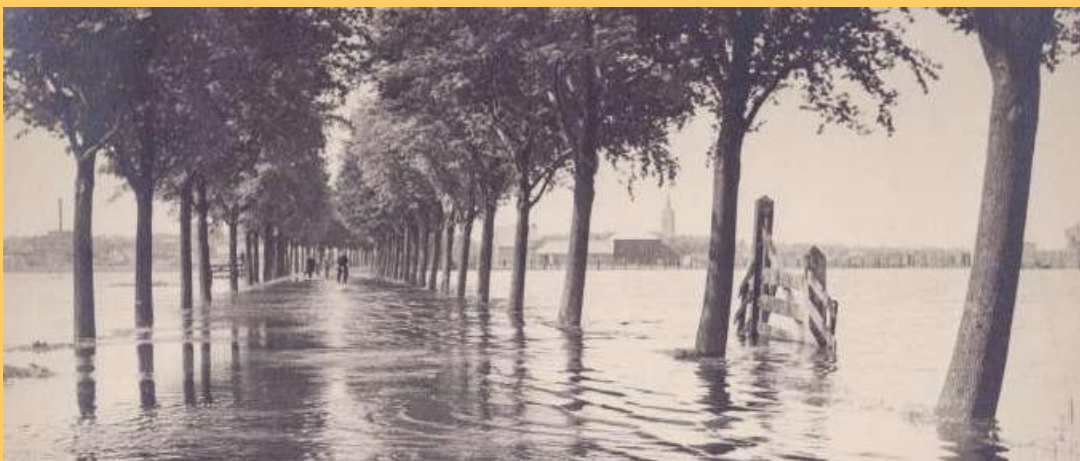
Inundatie van de Wijkermeerweg in de meidagen van 1940

In 1883 was men eindelijk zover om met de bouw van het Fort bij Abcoude te beginnen. Dit eerste fort bestond uit aardwerken, waarin zeven bomvrije ruimten waren aangebracht en werd omringd met een gracht. Helaas bleek het fort al direct achterhaald door de technische ontwikkeling. De komst van de brisantgranaat maakte het noodzakelijk om de forten uit beton, in plaats van metselwerk te vervaardigen. Om niet nogmaals in de fout te gaan werden er eerst uitgebreide proeven gedaan waarbij betonconstructies werden beschoten met het zwaarste geschut.