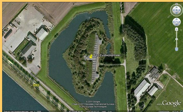
Fort aan de Sint Aagtendijk en Fort Zuidwijkermeer vanuit de lucht

Het bijzondere aan het fort aan de Sint Aagtendijk is een middenvoor aan de fortwal gelegen uitbouw van beton, welke aan weerszijden is voorzien van schietgaten voor het geven van zijwaarts gericht vuur. De voorzijde van deze, zo genoemde, caponnière was tegen granaatvuur beschermd door een zware aarden dekking. De bezetting van het fort was 308 man. Fort aan de St. Aagtendijk diende ter verdediging van de St. Aagtendijk en de westkade van de Zuidwijkermeerpolder. Het verdedigbare aardwerk kwam in 1895 gereed, het bomvrije gebouw in 1899. De forten St. Aagtendijk en Zuidwijkermeer worden met elkaar verbonden door een 2,5 km lange liniewal.