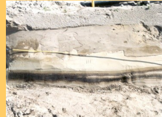
Ploegsporen, menselijke voetstappen en hoefsporen, steeksporen van een schep

De vroegste vondst dateert echter van 11.000 tot 4.500 voor de jaartelling, uit het mesolithicum, de tweede periode van het stenen tijdperk. Het is een vuurstenen werktuigje, een microliet gevonden op het kasteelterrein van Slot Assumburg. Waarschijnlijk is het gebruikt als pijlpunt. Het is de oudste en tevens kleinste archeologische vondst van deze omgeving. Meer vondsten uit deze periode zijn er echter niet.