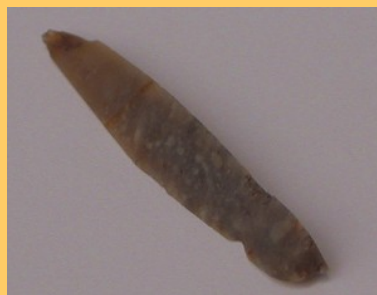
De microliet. Afm. 3 cm lang en 0,5 cm breed

Op de basisschool wordt veel meer aandacht besteed aan de recentere periodes, terwijl in de archeologie juist veel meer aandacht wordt besteed aan de vroegste periodes van de geschiedenis van de mens. Dat blijkt wel uit de onderverdeling. De archeologie heeft de vroege periodes van de geschiedenis van voor 1500 NJ opgedeeld in meer dan 12 periodes terwijl dat er op de basisschool maar 4 zijn. De periode van na 1500 NJ is daarentegen opgedeeld in 6 periodes waar de archeologie er maar één telt.