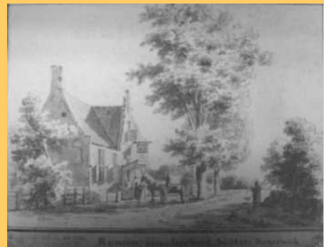
Herberg Oud-Romen in 1731

Bij het bezit hoorde inmiddels ook de herberg Oud-Romen bij de kruising van wegen ter plaatse van het huidige Westerhoutplein. Lucas Boreel liet de herberg slopen en bouwde ter plaatse een nieuw herenhuis. Het zeventiende-eeuwse huis dat meer naar het westen lag liet hij afbreken. Daarvan resteren alleen nog archeologische resten.