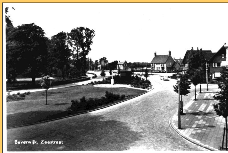
Het Westerhoutplein vanaf de Zeestraat.

In 1905 werd op de plaats van de voormalige stallen en koetshuis het Westerhoutplein aangelegd.