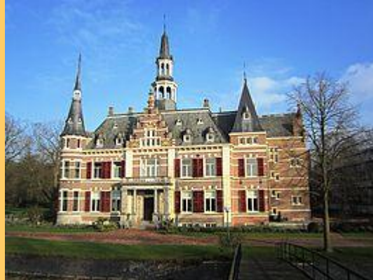
Landhuis de Cloese te Lochem