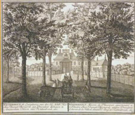
Het huis Westerhout rond 1730

In de noordoost hoek van een groot groengebied, omsloten door de Westerhoutweg, de Zeestraat en de Binnenduinrandweg, staat bij een verkeersplein een landhuis uit 1896. De geschiedenis van dit landhuis, bekend als huis Westerhout, gaat echter terug tot de vroege zeventiende eeuw. Achter het huidige huis ligt het park Westerhout. Het hoofdhuis en de dienstgebouwen aan de Westerhoutweg 3 en 22 zijn rijksmonumenten. Het park is tegenwoordig eigendom van de gemeente en openbaar toegankelijk wandelgebied.