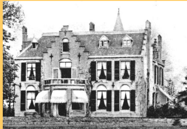
Westerhout, voor en achterzijde

Bovenstaande foto's laten de grote overeenkomsten zien tussen de drie gebouwen.