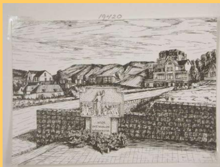
Oorlogsmonument Wijk aan Zee

Nieuwe groepen in de stad kwamen tot welvaart en ook zij wisten de weg te vinden naar de kust bij Wijk aan Zee. Winkeliers en arbeiders stapten op hun vrije zondag op de pakketboot in Amsterdam en voeren naar de steiger bij Velsen-Noord, toen nog Wijkeroog geheten. Vandaar wandelden zij door de Breesaap en het landgoed Rooswijk over de Bosweg naar de zuidvoet van het Paasduin en zo kwamen zij in Wijk aan Zee. Tegen de avond legden zij dezelfde weg af en voeren terug naar de kade achter het Centraal Station van Amsterdam.