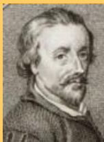
Gerard van Velsen

In 1313 werd Wijk aan Zee een hoge heerlijkheid. De ambachtsheer had al het recht om in civiele zaken en over kleine misdaden recht te spreken. Tevens mocht hij plaatselijke ambtenaren aanstellen. Door de verheffing tot hoge heerlijkheid werd ook het recht verleend om halsmisdrijven te berechten en kwam aan hem de volledige plaatselijke macht toe.