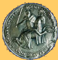
Wolfert van Borssele