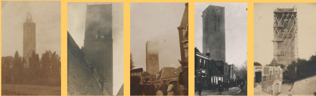
De toren in brand, met spits, zonder spits, na de brand en de herbouw

Op woensdag 21 augustus 1912 werd de wijkertoren gedeeltelijk verwoest door een fel uitslaande brand, hierbij werd het bovenste deel van de toren verwoest, de toren werd herbouwd, maar de tekst Fugit Hora (de tijd vliegt) die voorheen op de wijzerplaten van de klokken stond werd naar binnen verplaatst.