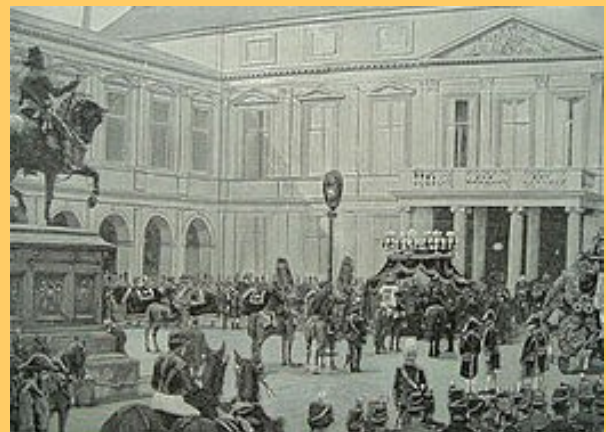
De begrafenis van Willem III

De bijzetting van de overleden koning op 4 december 1890 in Delft was erg slecht georganiseerd. Zo stortte een tribune in en waren er te weinig koetsen en parkeerplaatsen, waardoor velen te laat waren in de Nieuwe Kerk. Daarnaast was het steenkoud. Zonder enige waardigheid zou de kist al schommelend in de Koninklijke Grafkelder getakeld zijn, waarna Willem III der Nederlanden zijn laatste rustplaats had bereikt. De bloemen op de baar waren van de jonge Wilhelmina, met de tekst: Voor vader, van zijn lieve kind.