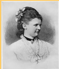
Prinses Emma van Waldeck-Pyrmont

Uiteindelijk wisten ministers hem te bewegen een vorstelijke echtgenote te zoeken. Er waren verscheidene kandidaten voor een huwelijk ondanks de gevorderde leeftijd van de koning. Zijn nicht Elisabeth van Saksen-Weimar en de Deense prinses Thyra. Beiden bedankten echter voor de eer. Op advies van zijn zuster liet hij zijn keuze vallen op één van de dochters van vorst George Victor van Waldeck-Pyrmont die meerdere huwbare dochters had. In eerste instantie werd prinses Pauline voorgesteld als de beste kandidate.